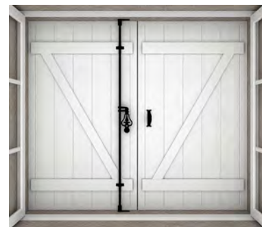
Vue de l'intérieur sans traverses