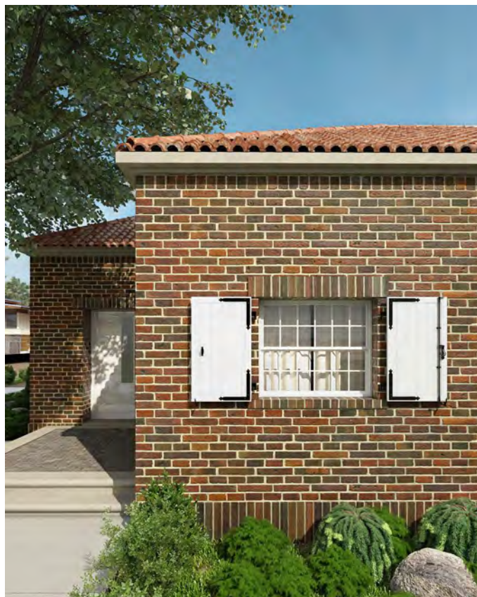
Vue extérieure avec traverses en bas